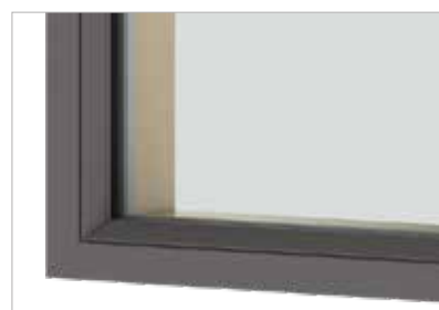
➤ Indvendig glasliste som indbygget sikkerhed