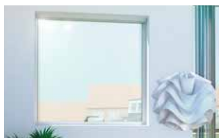
➤ Smal ramme giver større lysindfald

Selve rammen er desuden forsynet med indbrudsforebyggende beslag. Hos VELFAC anvender vi ikke standardbeslag, men fremstiller selv alle vores beslag - og de er udviklede til de enkelte vinduesserier.