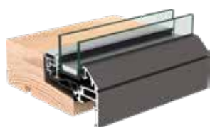
➤ VELFAC Edge karmudsnit

VELFAC Edge leveres med 2-lags rude og er B-mærket. Med aluminium på ydersiden, som blot kræver minimal vedligeholdelse - og malet træ på indersiden får du et vindue, der holder i både form, funktion og udtryk.