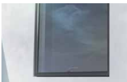
➤ Tilbagelagt fuge for en svævende ramme